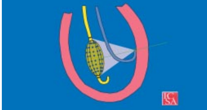
Fig. 1 - Schema della posizione del catetere Ensite all'interno della camera cardiaca in esame. Si genera un potenziale elettrico di 5.6 kHz tra la punta del catetere mappante e due elettrodi distali e prossimale della maglia del pallone "balloon" Ensite. Il segnale genera un campo elettrico ("forza di campo") con proprietà decrementali nello spazio. Il campo elettrico generato è mappato dalla maglia di elettrodi e convertito in informazione spaziale.

le di un sistema di mappaggio non a contatto (Ensite, Endocardial Solution, Inc., St. Paul, MN, USA) consente, attraverso una maglia multielettrodo posta nella porzione distale rigonfiabile del sistema (Fig. 1) di registra-