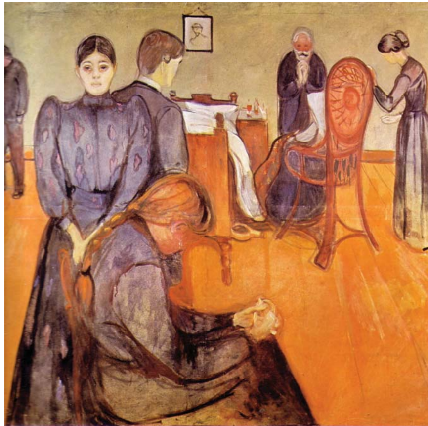
Fig. 3 - E. Munch - Morte nella camera del malato (1892).

Anche il significato di empatia acquista nuove chiavi di lettura alla luce degli sviluppi degli studi sperimentali di PNEI.