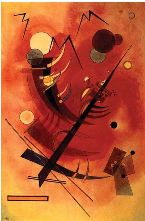
Fig. 1 - W. Kandinskij - Tormento interiore (1925).

Non è facile, per il medico, entrare in contatto con la sfera della componente soggettiva della malattia, risonanza emotiva alla sofferenza e immaginari di angoscia che compongono l'insondabile tormento interiore di molti malati.