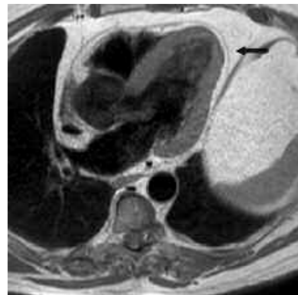
Fig. 1 - RM T1 W, 5 camere. Soggetto con abbondante adiposità (in grigio chiaro) epicardica e mediastinica; il pericardio (freccia) è ben delineato all'interno del grasso. Lo spessore del grasso è maggiore a livello della parete libera del ventricolo destro, dando luogo al comune reperto di spazio eco privo anteriore, da differenziare rispetto ad un versamento pericardico.

La presenza o meno di versamento pericardico va valutata con cautela, dato che uno spazio ecoprivo localizzato solo o molto prevalentemente in corrispondenza della parete libera del ventricolo destro generalmente è dovuto alla presenza di grasso epicardico o pericardico. Grasso epicardico e pericardico sono di osservazione comune con RM, e in talune persone raggiungono spessori di vari centimetri, soprattutto nei soggetti obesi ( Fig. 1 ).