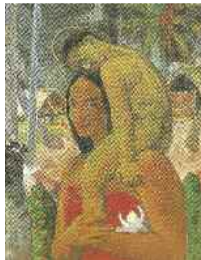
Paul Gauguin - la orana Maria (Je vous salue Maria) - (particolare).

Natale è il momento della storia dell'uomo in cui il trascendente incontra l'immanente. Un incontro "ufficiale", poiché da sempre la natura dell'uomo si era rivolta a guardare verso l'alto. Un incontro forse necessario, affinché la Parola diventasse chiara e gli orizzonti si ampliarono, all'unisono con il dilatarsi degli spazi del cosmo. Un Big Bang dello Spirito, che segna lo scrimine, nell'animo dell'uomo, fra implicitezza inespressa e la nuova consapevolezza di infinito, suggerita da un'epifania insieme umana e divina.