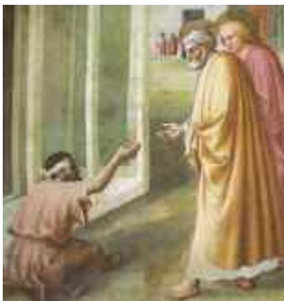
Masaccio - La guarigione dello zoppo (particolare).

Natale è il momento della storia dell'uomo in cui il trascendente incontra l'immanente. Un incontro "ufficiale", poiché da sempre la natura dell'uomo si era rivolta a guardare verso l'alto. Un incontro forse necessario, affinché la Parola diventasse chiara e gli orizzonti si ampliarono, all'unisono con il dilatarsi degli spazi del cosmo. Un Big Bang dello Spirito, che segna lo scrimine, nell'animo dell'uomo, fra implicitezza inespressa e la nuova consapevolezza di infinito, suggerita da un'epifania insieme umana e divina.