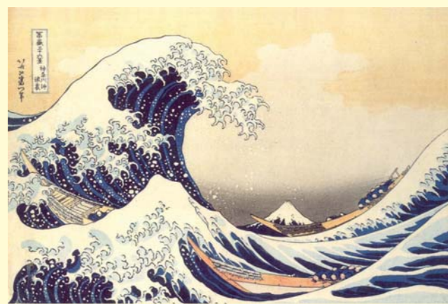
Katsushika Hokusai - Great Wave Off Kanagawa (1823-29 ca.)

di identificare le principali problematiche di tipo psicologico presenti e dunque anche verso quale fascia di età, ad esempio, rivolgere gli interventi. Resta