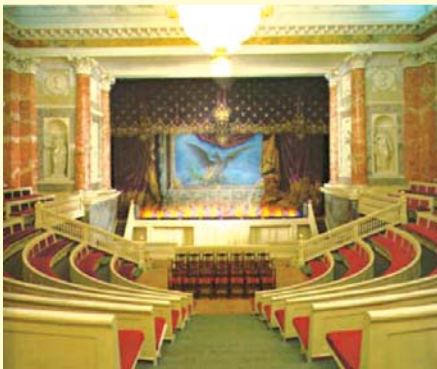
Illustrazione del teatro all'interno dell'Hermitage San Pietroburgo (Russia)

Questo spazio, in fondo alla quarta pagina dedicata alla sala d'attesa è stato finora occupato da una ricetta a basso