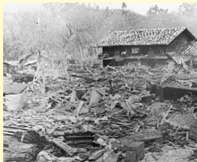
Una scena di distruzione dopo il passaggio dell'onda.

conta di chi ha visto andarsene tra i flutti, di chi non ha mai saputo nuotare e non ha trovato un albero o qualcosa cui aggrapparsi.