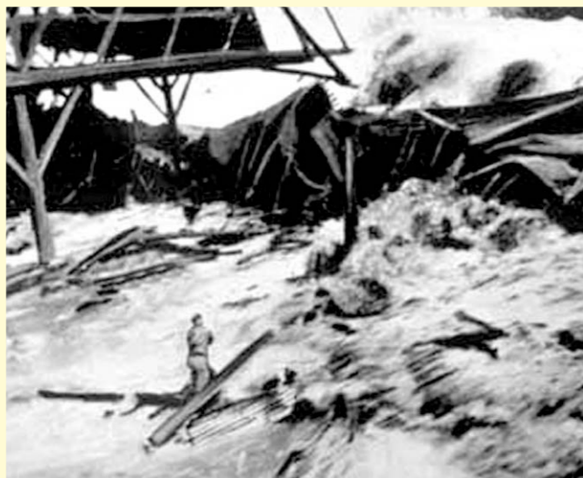
Questa immagine immortala l'impressionante sopraggiungere dell'onda.

anche lei si senta quasi in colpa per essersi salvata. Non dorme più la notte, non ha più aspettative per il suo futuro. Quello che è accaduto un giorno potrà accadere tutti i giorni. Continua a sentire il rumore dell'acqua e di tutto quello che si è portata via. Mi domanda cosa può fare, mi dice che tutti stanno come lei. Un bambino mi mette in braccio il fratellino di un anno, voleva