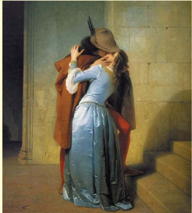
Francesco Hayez - Il bacio (1859)

"Ma tutto ciò che appena ne disfiora ci prende insieme al pari dell'archetto, che da due corde trae una sola voce".