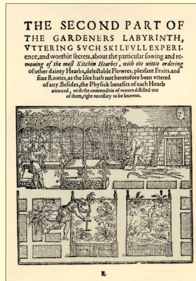
The Gardener's Labyrinth (1577)

"principio di realtà", è nel nostro caso assai pertinente, anche perché il dono è soprattutto un gesto di gratificazione, prima ancora di costituire (se poi lo costituisce) un dono verso l'oggetto amato.