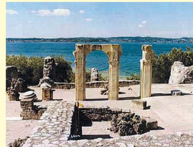
Le “Grotte di Catullo” (Sirmione - BS)

dominante, come una balconata affacciata sull'anfiteatro dei monti. Monti coronati spesso ancora di neve, quando già sul lago è primavera. Penisola verdeggianta, sottile; a guardarla dall'alto apparentemente fragile, quando il vento del nord solleva in bianchi frangenti la superficie del lago, se non fosse