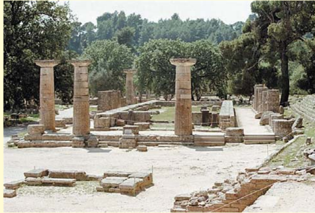
Tempio di Olympia

κ'εν'η καρδιά μου - σ'αν νεκρός - θαμ'μένη