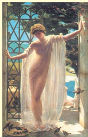
John Reinhart Weguelin Lesbia, 1878 - Collezione privata

Con la delusione, muore per il poeta ogni gioia di vivere. E il dolore si stempera nei versi di una poesia senza tempo. Nei Carmi, alla disperazione succede la rassegnazione e la malinconia della memoria. La “candida puella” che dolcemente ride rimarrà comunque sempre nel cuore del poeta. Ed è proprio nella pace della sua villa di Sirmione che Catullo sembra trovare la tranquillità dell'anima, dopo i tormenti dell'amore tradito, recuperando momenti di serenità rarissimi nella sua